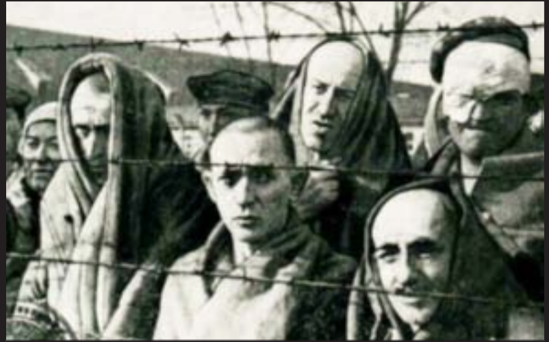
Узники концентрационного лагеря Освенцим. (Из документов Чрезвычайной Государственной Комиссии)

11 апреля 1945 года узники Бухенвальда подняли интернациональное восстание против гитлеровцев, и вышли на свободу. По решению Организации Объединенных Наций, этот день утвержден как Международный день освобождения узников фашистских концлагерей. В концлагере Бухенвальд содержались десятки тысяч заключенных из 18 стран. 11 апреля 1945 года освобождены узники фашистских концлагерей Бухенвальд и Дора, 22 апреля освобождены узники Заксенхаузена, 29 апреля – Дахау, 30 апреля 1945 года – Равенсбрюка. На территории Германии и оккупированных ею стран действовало более 14 тысяч концлагерей. За годы второй мировой войны через лагерь смерти прошли 18 миллионов человек, из них 5 миллионов – граждане Советского Союза. 10 апреля, в Малом зале Мариинского дворца состоялся традиционный торжественный прием представителей общественных организаций бывших узников фашистских лагерей. У монумента героическим защитникам Ленинграда на площади Победы, а в 12.00 у закладного камня на месте установки памятника бывшим узникам фашистских концлагерей (Красное Село, Ландшафтный парк) состоялись торжественно-траурные церемонии возложения венков и цветов.